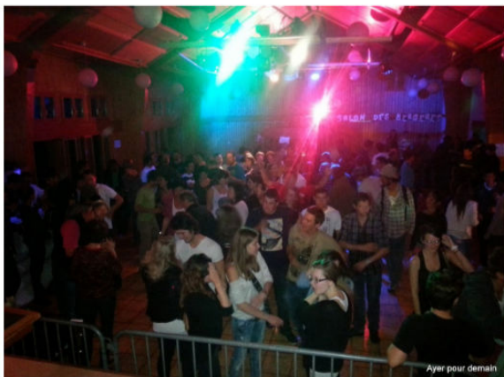
Bal des bergères au Foyer Lyrette le 22 septembre 2013

Dès 22h - Entrée libre - Sortie de secours